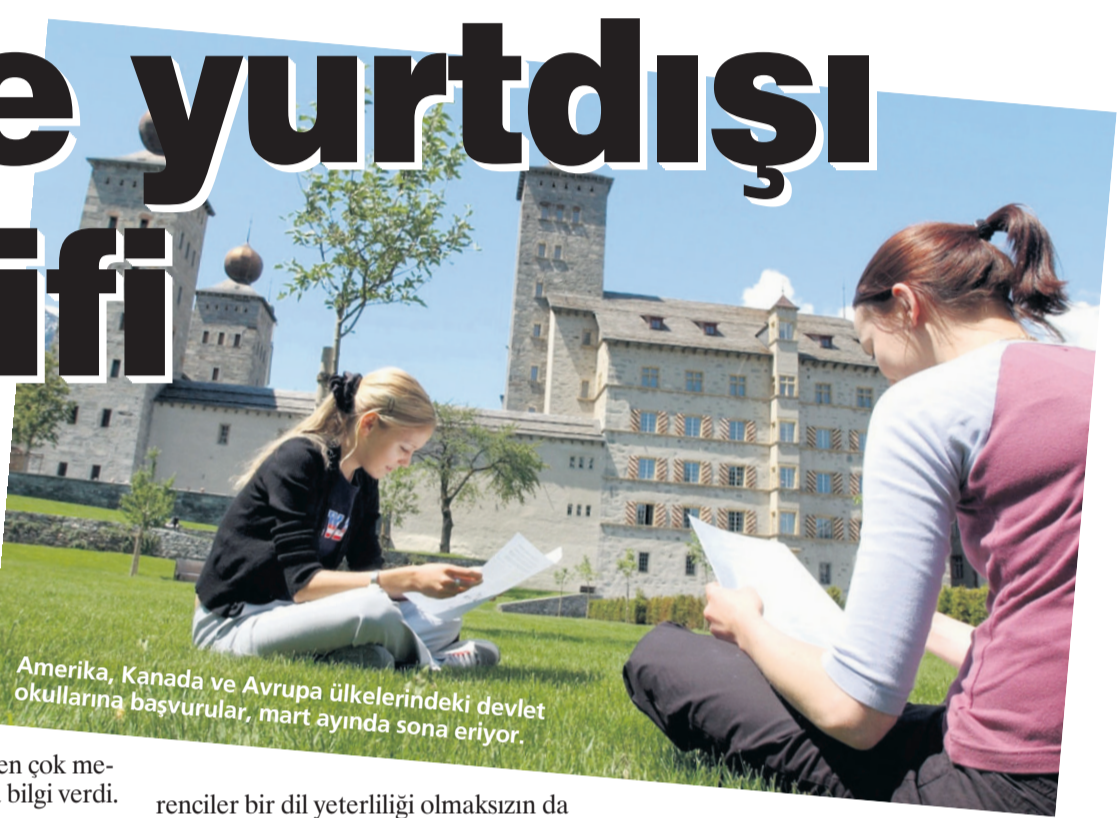
Amerika, Kanada ve Avrupa ülkelerindeki devlet okullarına başvurular, mart ayında sona eriyor.

Yurtdışında lise okumanın maliyeti ülkeden ülkeye değişiyor. En pahalı okullar İsviçre'de; yıllık öğrenim ücreti 90 bin Euro'ya kadar çıkıyor. Başvuru koşullarında çok esnek olan Kanada ise yıldızı parlayan ülkeler arasında